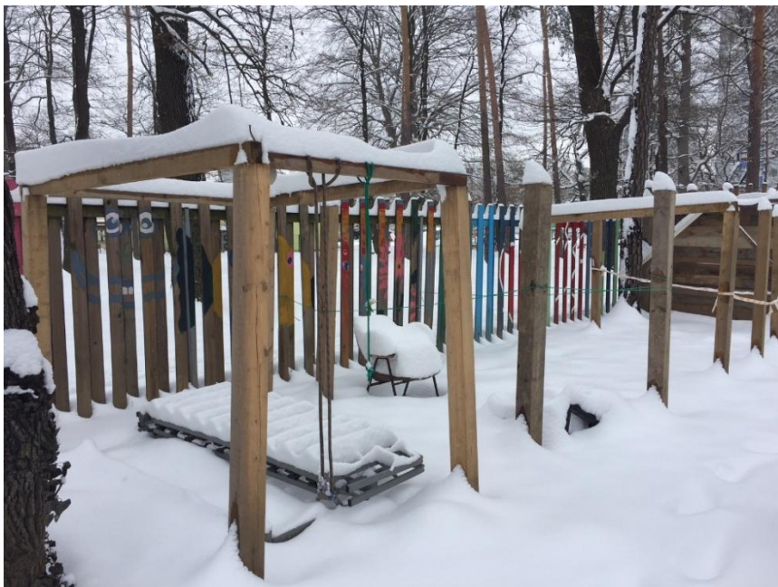
Hiše v začetni fazi gradnje

Reciklirane hiše se v skladu z dogovorjenimi pravili razgradijo po mesecu neuporabe ali pa ker se uporabniki tako odločijo, kot v Žigovem primeru. Njihove parcele lahko rezervirajo drugi otroci, material pa se ponovno uporabi za gradnjo.