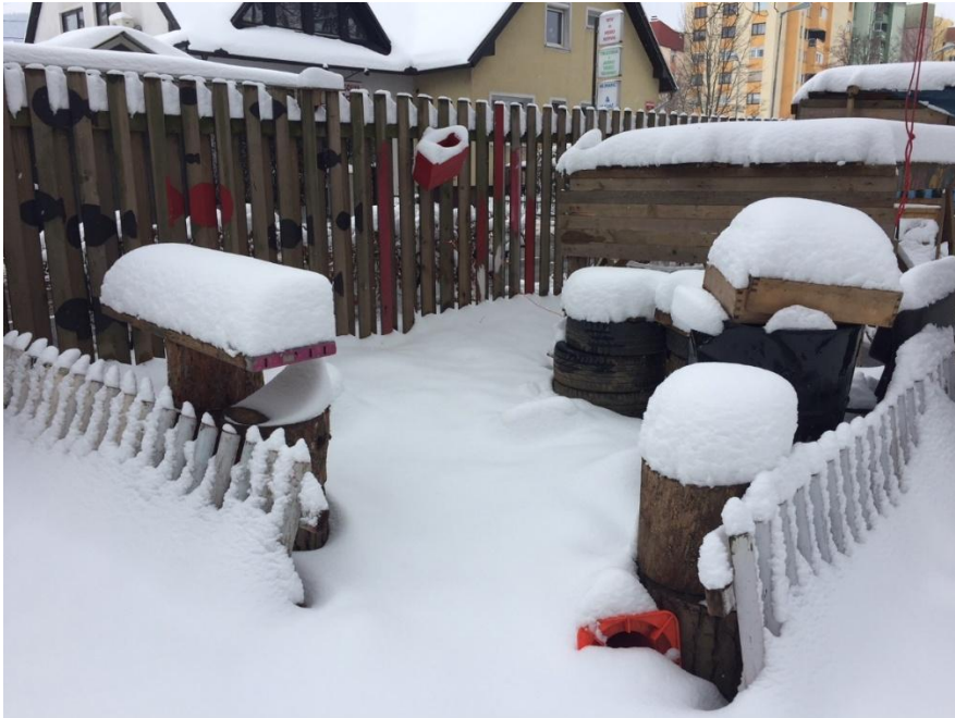
Matijeva hiša je bila včasih sodišče

Zraven stoji Matijeva hiša, ki je odprtega tipa, brez sten in strehe, opremljena je s smetnjaki iz odpadnih avtomobilskih gum. V njej je bilo včasih sodišče, v katerem je Matija kot sodnik urejal spore, če so se otroci prepirali med seboj.