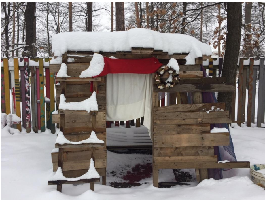
Aleksandrina hiška ob vhodu v Gradbišče

Posebej lično oblikovane so hiške deklet, opremljene z zavesami, okraski in drugimi pripomočki. Aleksandrina hiša je okrašena s cvetličnim venčkom na vhodu in v notranjosti posuta s cvetnimi listi.