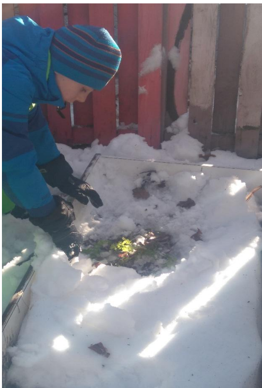
Peteršilj na skupnem vrtičku

Visoke grede na skupnem vrtu so prekrivane s snegom, pod katerim še vedno rastejo jagode, peteršilj in čebula. Lansko leto so na vrtu zasadili tudi korenček in solato, ampak z njima ni bilo nič, sta pa obrodila čebula in češnjev paradižnik.