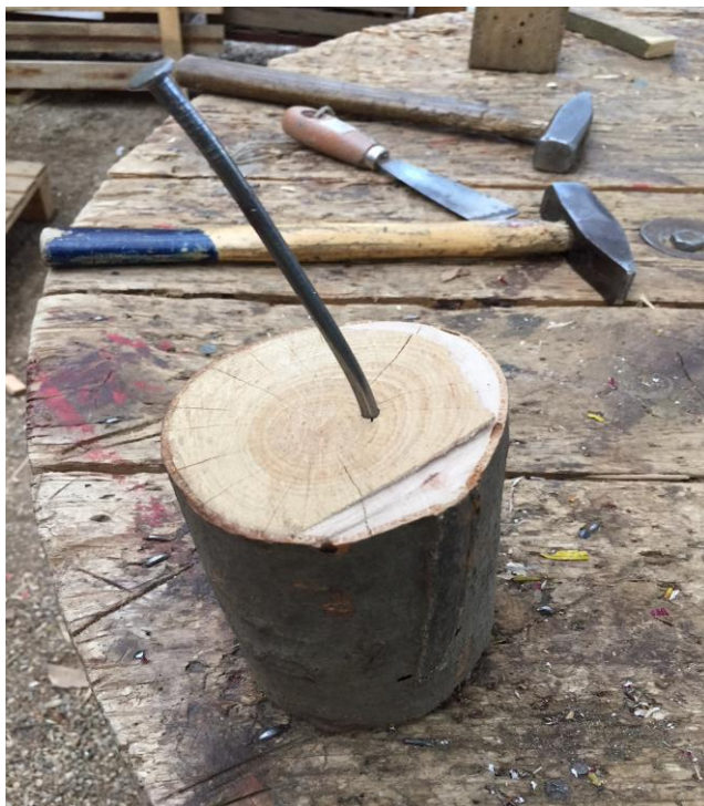
Prva faza izpita za sekiro

Lesarski kotiček ima veliko rednih in vsak dan tudi nekaj občasnih obiskovalcev. Štiriletnik veselo odnese babici na ogled nekaj žebeljev, zabitih v desko. Na drugem koncu Lesarskega kotička oče ponosno gleda čez hčerkinjo ramo, ko zabija svoj prvi žebelj.