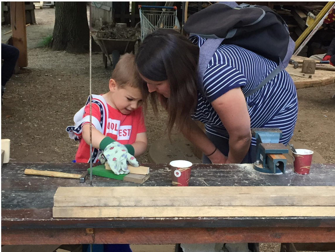
Zabijanje prvih žbljev poteka ob pomoči staršev

Po uvodnem pogovoru in načrtovanju se deklica odpravi po orodje v Lopo in poišče primerne kose lesa za hiško.