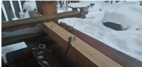
Gugalnica na popravilu

Po uvodnem pogovoru in načrtovanju se deklica odpravi po orodje v Lopo in poišče primerne kose lesa za hiško.